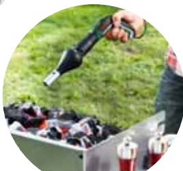
Насадка для розжига гриля «BBQ»